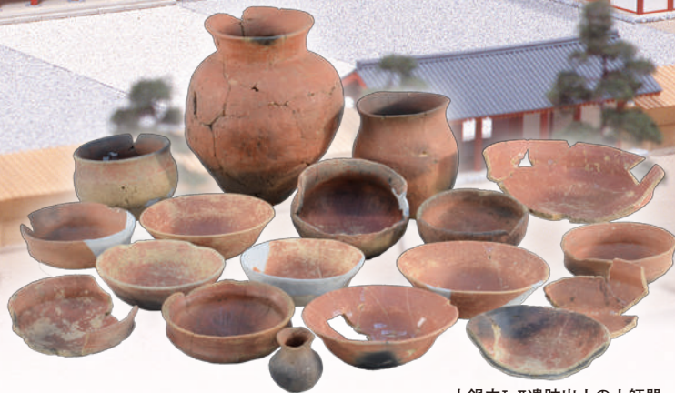
小鍋内I・II遺跡出土の土師器