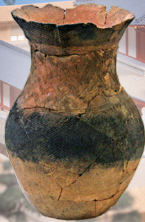
伊勢崎II遺跡出土の弥生土器