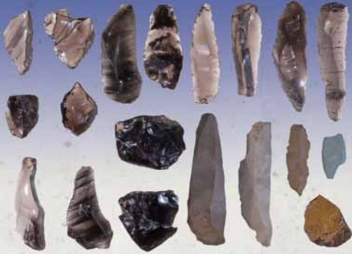
西刑部西原遺跡出土石器