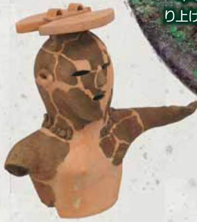
琴平塚古墳群出土埴輪(女性)