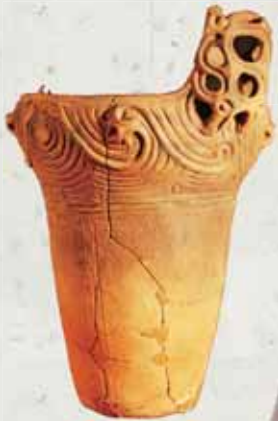
三輪仲町遺跡出土深鉢

本セミナーでは、展示コーナーのうちの2つを取り上げて、その内容を分かりやすく説明します。