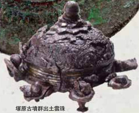
塚原古墳群出土雲珠

実施期間 平成27年 12月19日(土) ～平成28年 1月16日(土) 時間 13:30～15:30