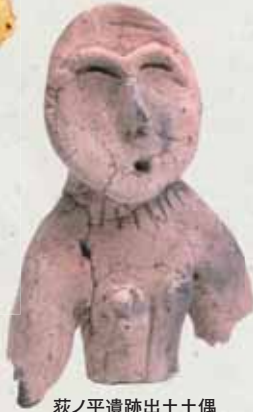
荻ノ平遺跡出土土偶