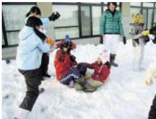
生き生き体験活動事業（親子でレッツエンジョイ）