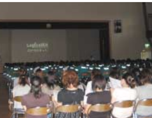
親子学び合い事業