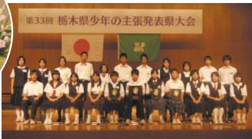
少年の主張（県大会）