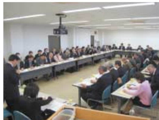
市町村民会議全体連携会議