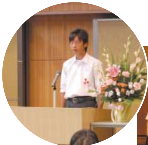
少年の主張（地区大会）