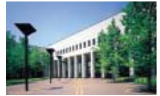
県民会議の入る総合文化センター