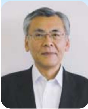
(財)とちぎ未来づくり財団

【発行】財団法人とちぎ未来づくり財団 宇都宮市本町1 8栃木県総合文化センター内 TEL028 643 1005 FAX028 650 5284 E-mail:ikusei@tmf.or.jp